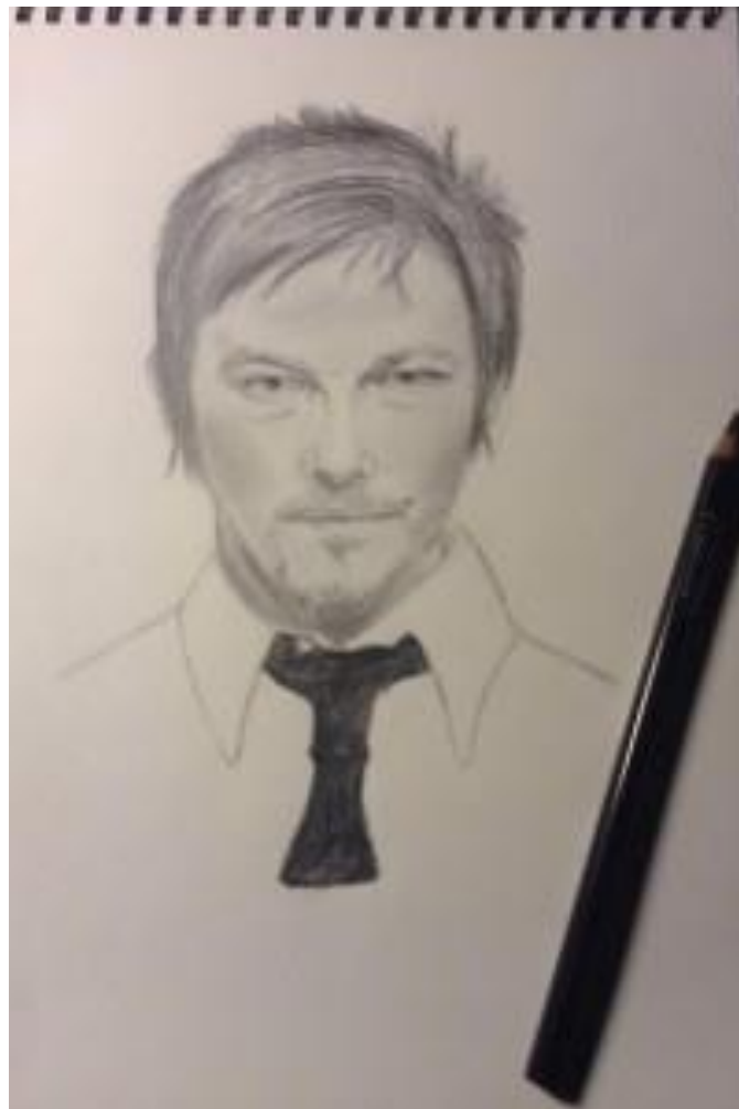
Portrait d'environ 4 heures de l'acteur Norman Reedus au crayon HB, 2B,4B et 6B.