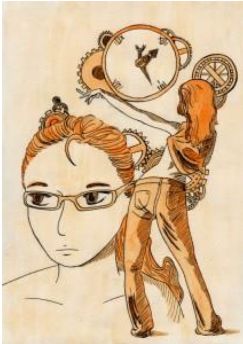
Dessin à l'encre et à l'aquarelle, 3h environ, d'après photos issues de artists.pixelovely.com