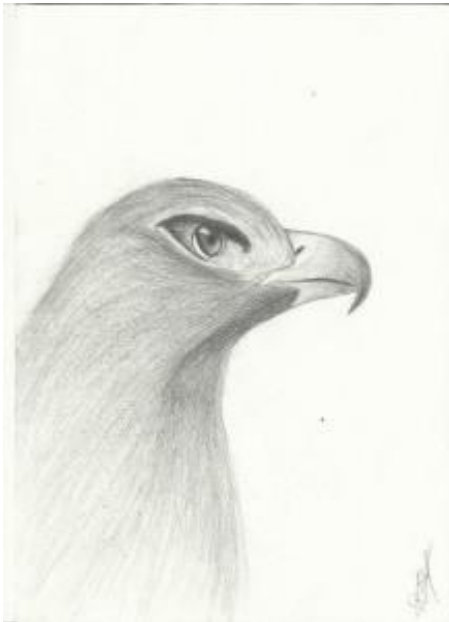
Dessin d'aigle fait en 2B et 2H, environ 1:30 de travail.