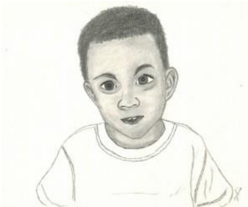
Portrait de mon fils d'après photo : crayon papier B et 4 B, 3 h ; et un dessin à base de lettre, feutre noir, 15 mn.