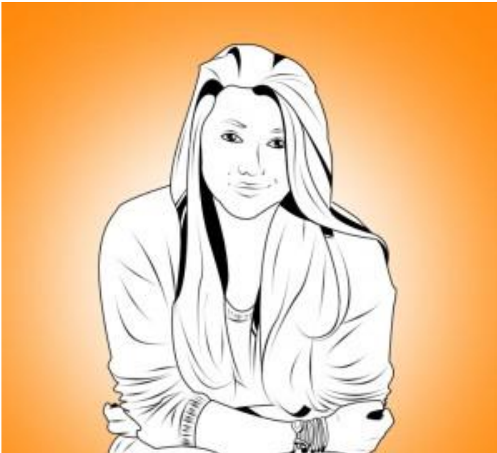
Portrait numérique d'une amie réalisé en 8 heures sur Photoshop ! :)