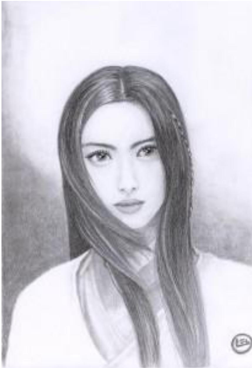
Oboro (du film Shinobi) Dessin traditionnel fait à la mine noire et au crayon graphite (3H principalement) sur papier A4 190g/m 2 en décembre 2013. Environ 10h de travail.