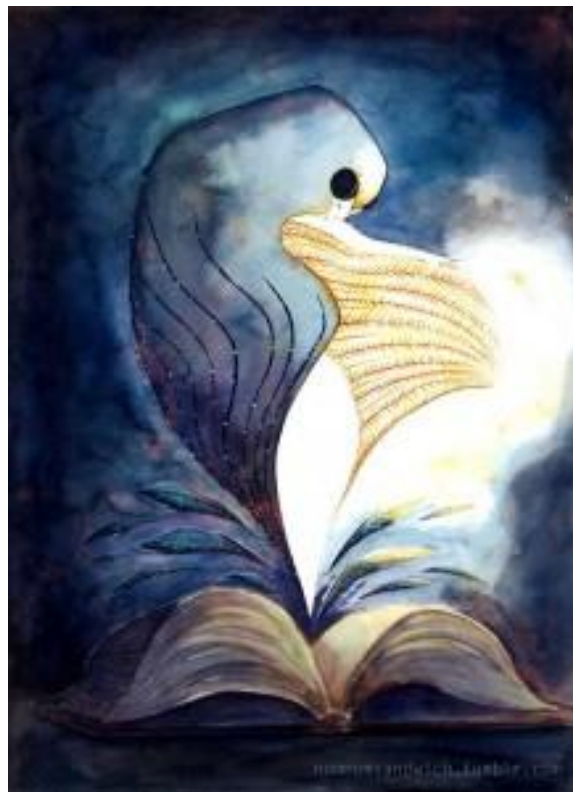
Illustration d'imagination, réalisée à l'aquarelle avec retouche Photoshop, 8 heures de travail environ.