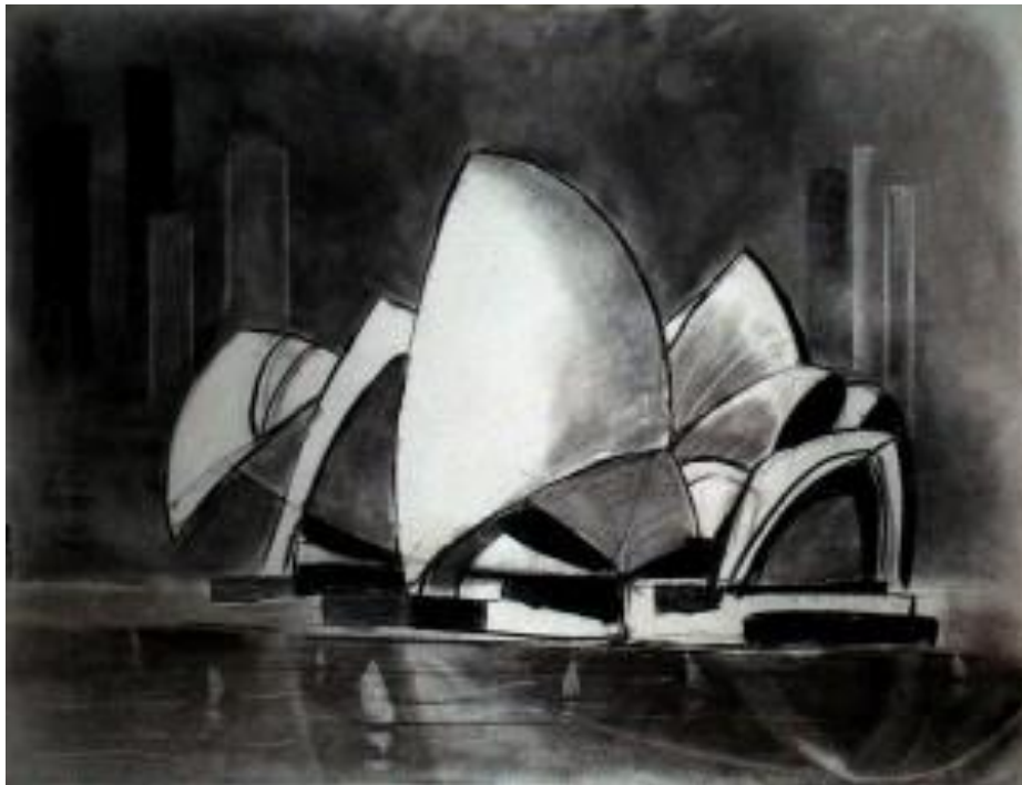
Tableau que j'ai fait sur l'opéra de Sidney, entièrement réalisé au fusain il y a un peu plus d'un an et demi et qui pour l'heure est toujours celui que je considère comme le plus réussi (même s'il n'est pas parfait). Je l'ai réalisé à partir de quelques photos de l'opéra et il m'a fallu 4 heures pour le réaliser.