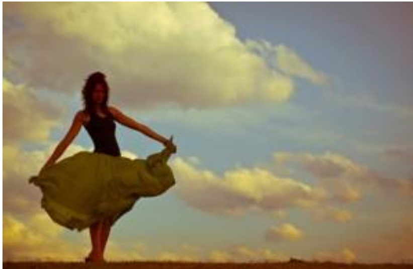
Couleurs moyennement vibrantes

On dit qu'une illustration est moyennement intense , lorsque la palette utilisée comporte une gamme équilibrée de gris colorés et de couleurs intenses, sans aller pour autant dans les extrêmes.