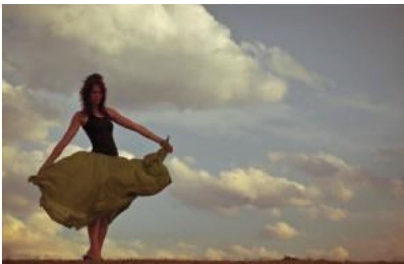
Couleurs peu vibrantes

On dit qu'une illustration est peu vibrante , lorsqu'elle ne comporte que peu de couleurs intenses. Les yeux du spectateur peuvent en général plus se reposer dans certaines parties de l'illustration et en conséquence cela les fatigue moins, mais l'illustration peut paraître un peu fade si aucune couleur ne relève la palette.