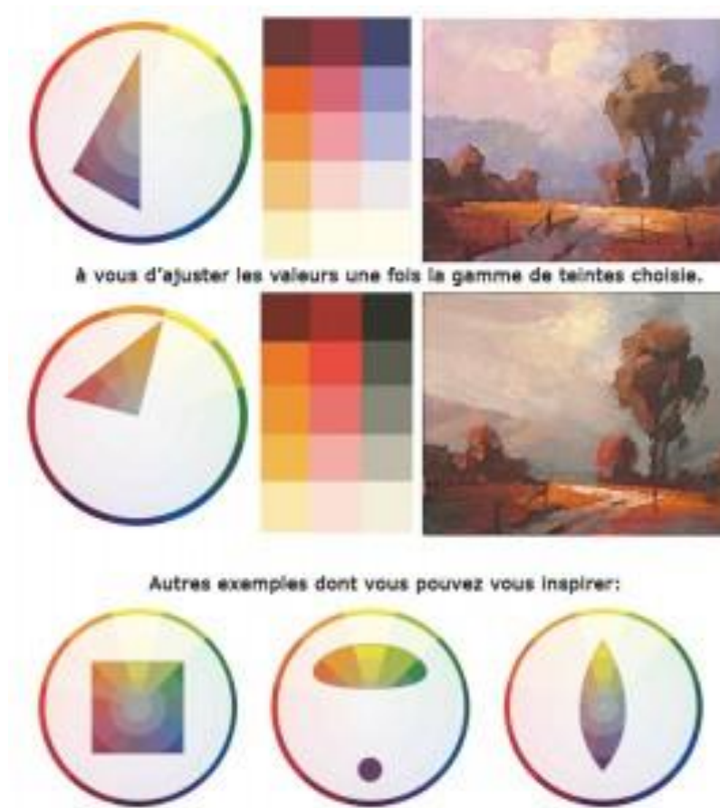
Essais de R.Robinson (peinture à l'huile)

Il est possible aussi de vous amuser en relevant des défis. Vous pouvez appliquer des espèces de masques pour cacher certaines parties de la roue chromatique. C'est plutôt amusant à faire et les résultats peuvent être intéressants au moment de poser les couleurs sur votre illustration.