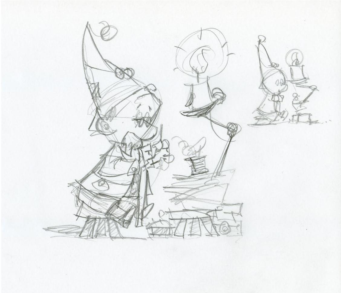
Étape du croquis et de la vignette

Therefore the composition of the picture does take advantage of the little black and white thumbnail.