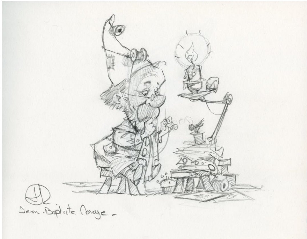
Étape du croquis plus détaillé

Ce qui me plaît particulièrement dans ton travail, c'est la facilité (apparente) avec laquelle tu produis tes croquis initiaux, et de constater que tu finis avec des crayonnés vivants à ce point. Peux-tu nous montrer quelles sont les étapes de tes croquis initiaux, depuis la vignette jusqu'à un crayonné un peu plus poussé ? Quelles sont les pensées qui te traversent l'esprit avant et pendant que tu dessines ?